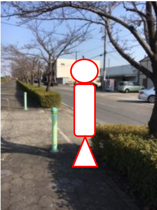
上り（稲沢市民病院行き）