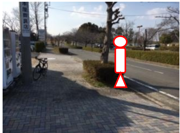
下り（ふれあいの郷行き）