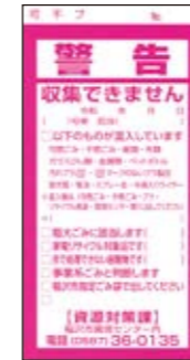
Nhãn cảnh báo