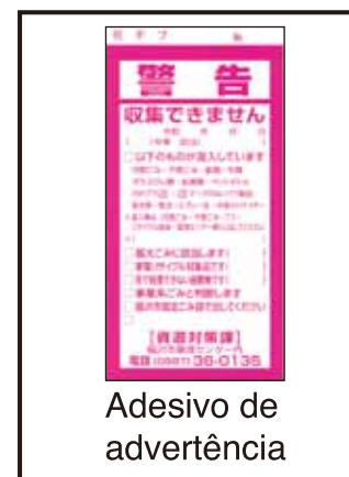
Adesivo de advertência

*Informe-se na Divisão de medidas de recursos sobre os dias de realização da coleta e o local (☎0587-36-0135).