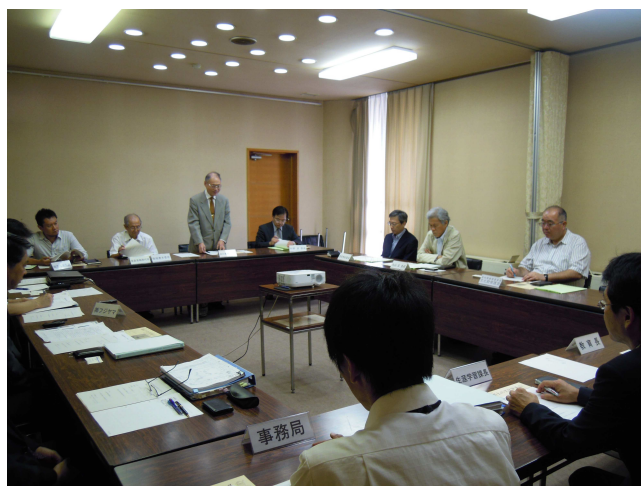
写真2 専門部会の様子