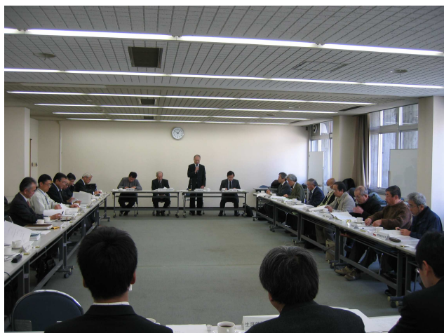
写真1 史跡保存整備委員会の様子